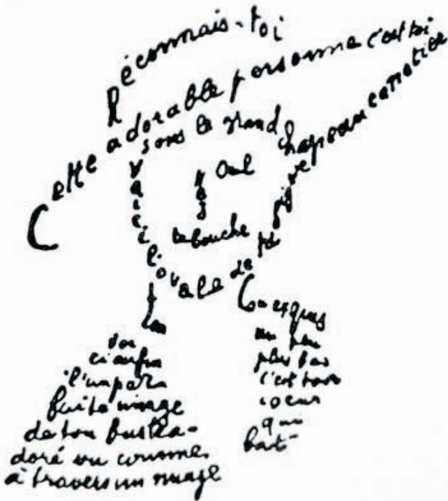
Poème à Lou, Calligrammes : poèmes de la paix et de la guerre Guillaume Apollinaire

*Un calligramme est un poème qui prend la forme de ce qu'il raconte. Cette poésie graphique existait déjà à l'antiquité mais, bien plus tard, c'est Guillaume Apollinaire qui inventera le mot calligramme en associant « calligraphie » et « idéogramme ».